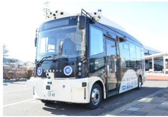
ティアフォー製Minibus導入