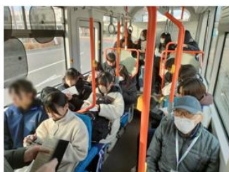
2日目以降、朝3便目はほぼ満席