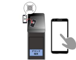
固定型予約端末機及びWeb予約システムの導入