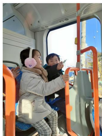
毎日乗車した幼稚園児