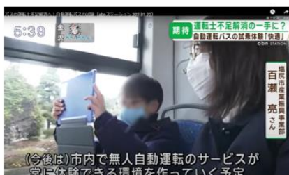
(今後は)市内で無人自動運転のサービスが 富に体験できる環境を作っていく予定 自動運転を研究する親子の試乗