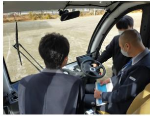
地域人材による運行体制構築