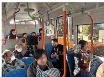
幼稚園児・高齢者・移住者家族を含む試乗