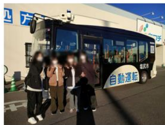
毎朝自動運転バスにて登校した高校生